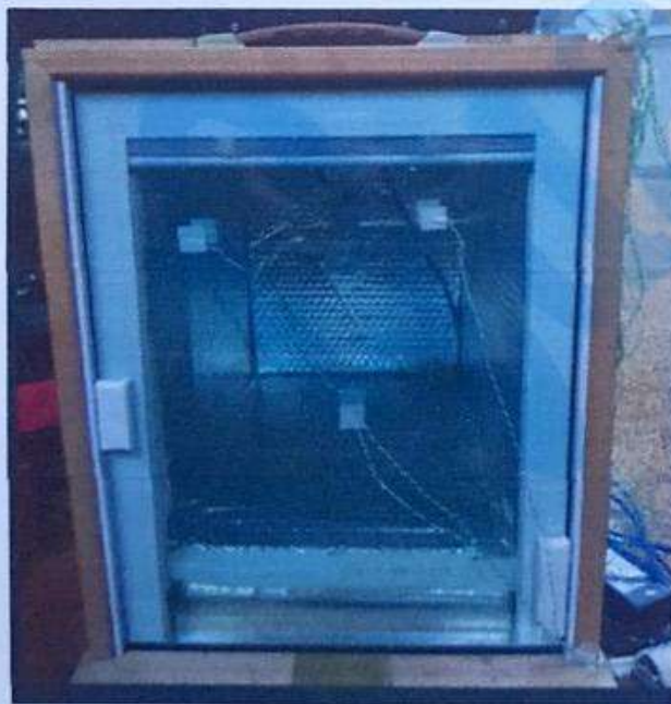
Hình ảnh mẫu